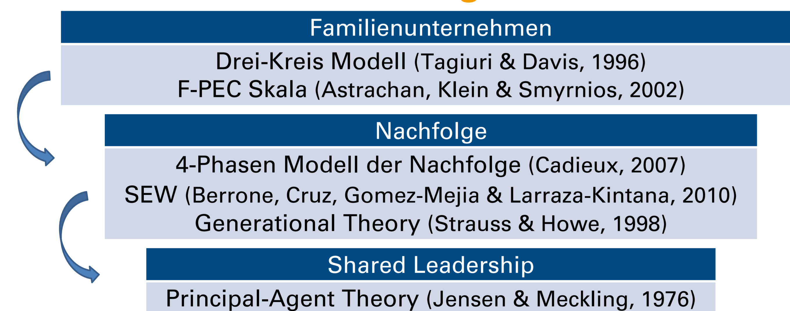
Abbildung 1: Theoretischer Hintergrund (eigene Darstellung)