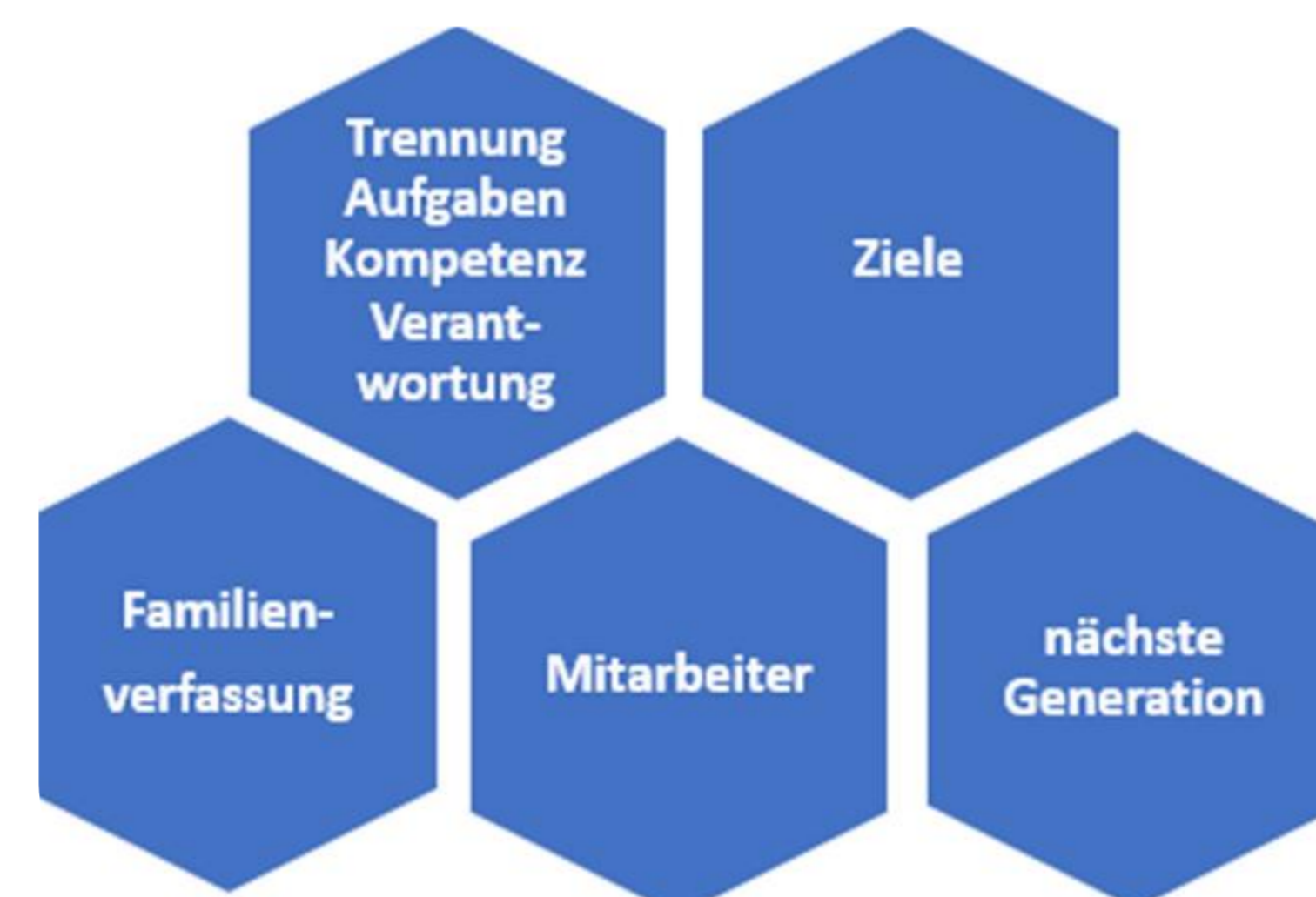
Abbildung 3: Herausforderungen bei der Einführung einer Tandemführung (eigene Darstellung)